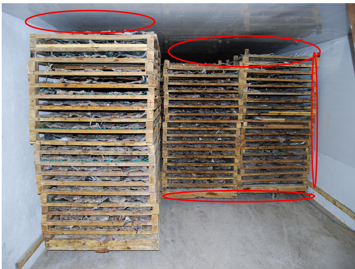
Bilde fra tørketunnel med angitte områder hvor meste tørkeluft strømmer.